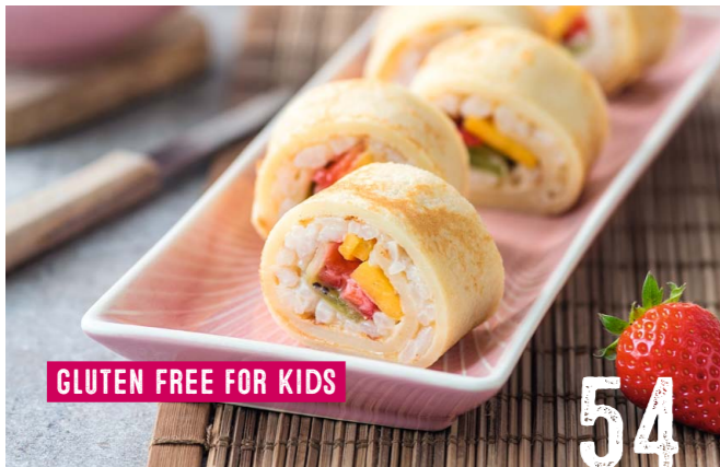
GLUTEN FREE FOR KIDS