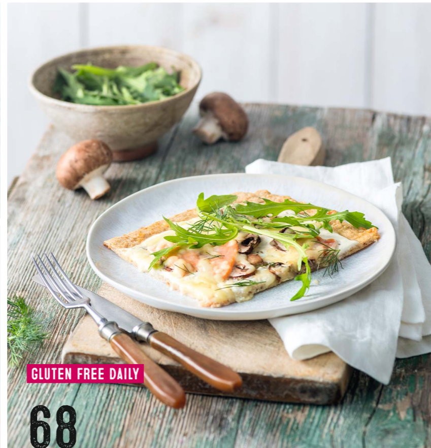
GLUTEN FREE DAILY