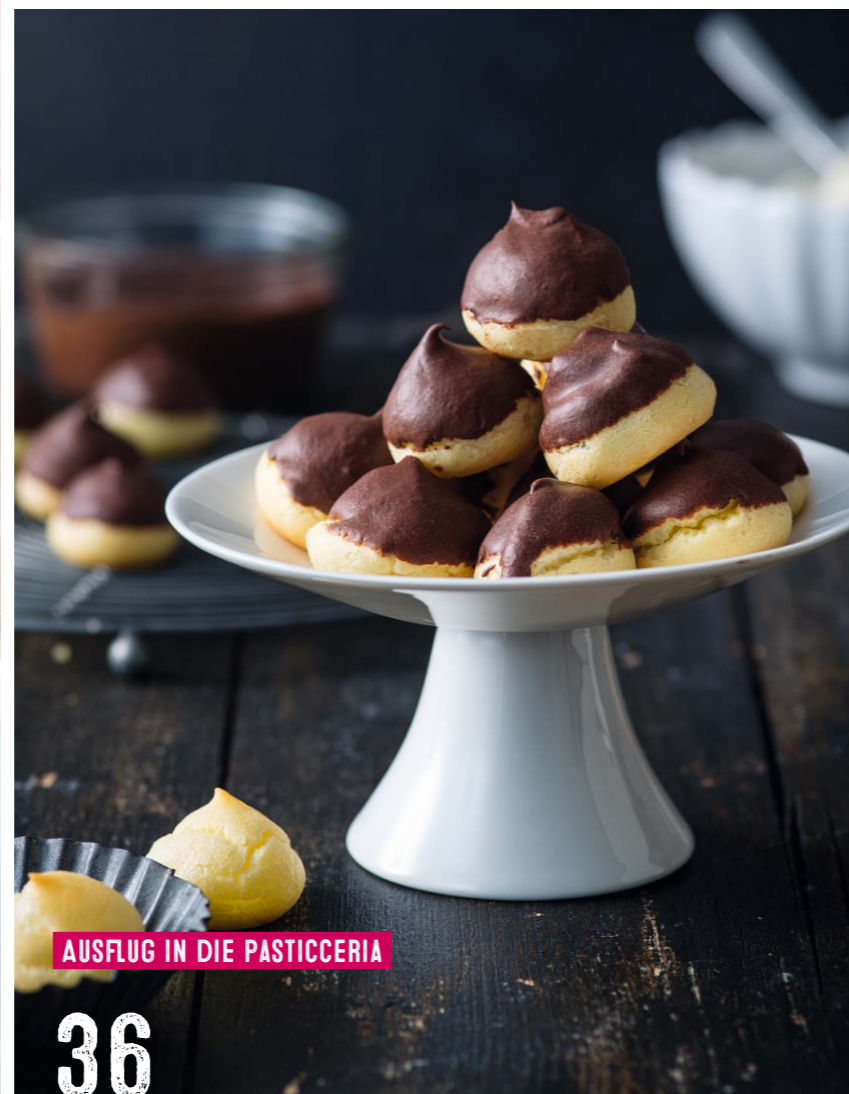
AUSFLUG IN DIE PASTICCERIA