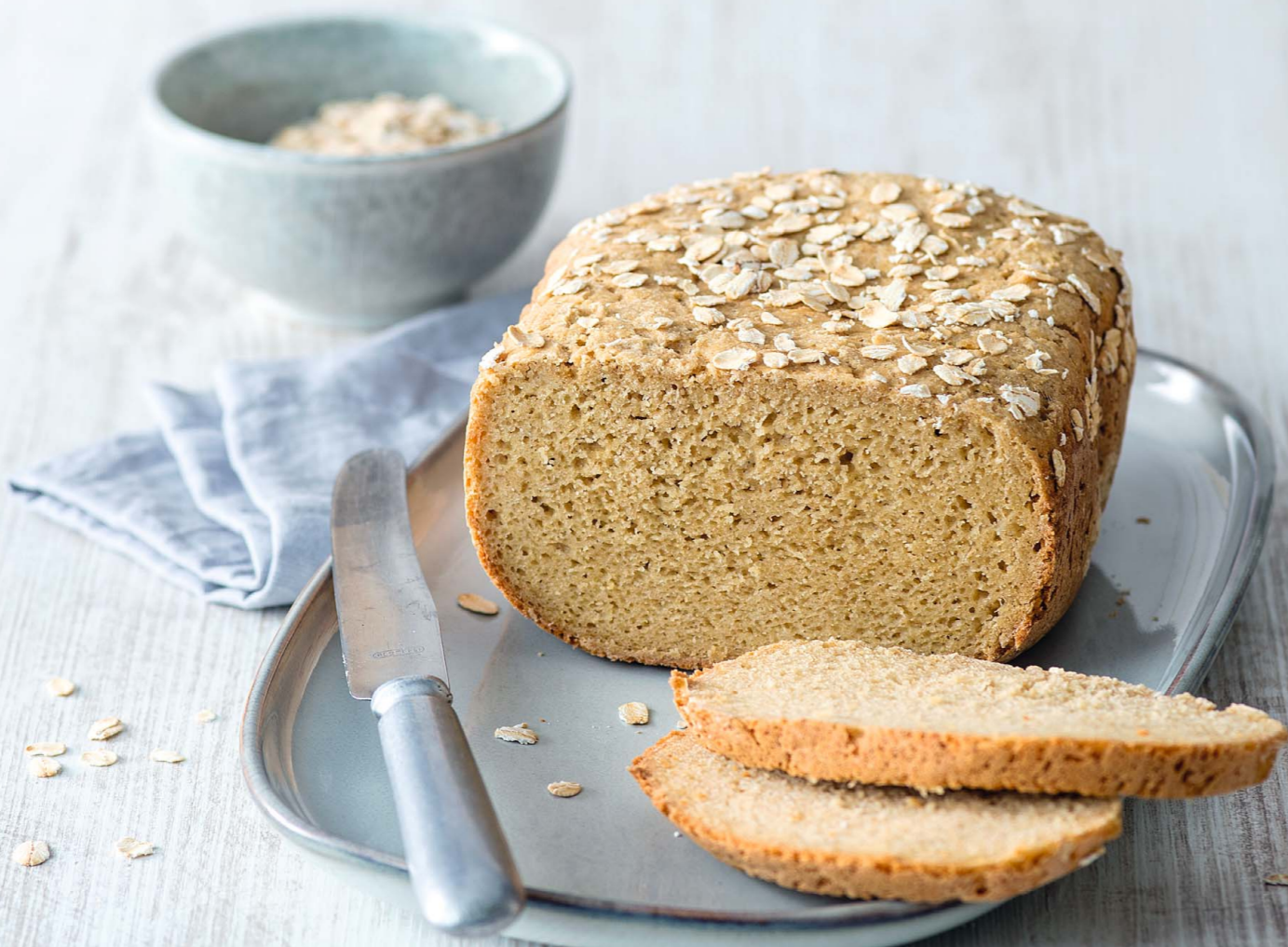
HAFERBROT SEITE 33