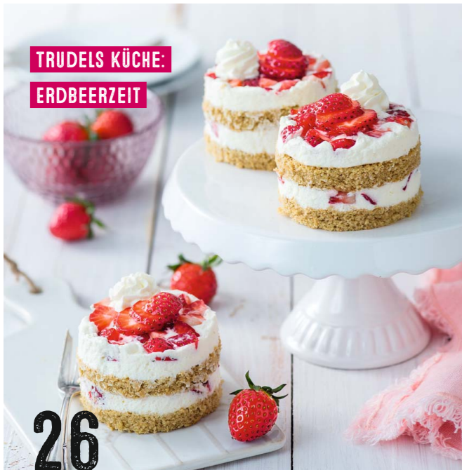
TRUDELS KÜCHE: ERDBEERZEIT