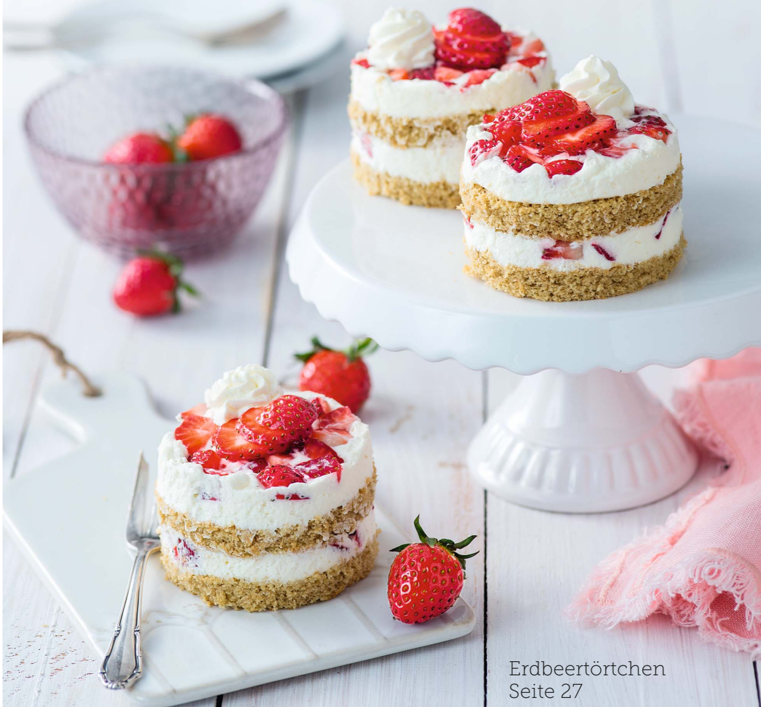
Erdbeertörtchen Seite 27