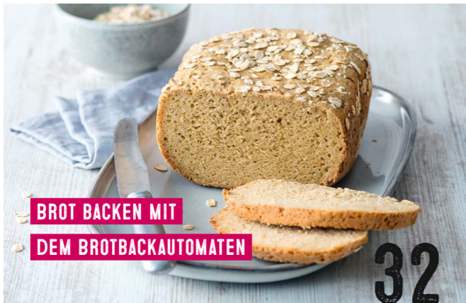
BROT BACKEN MIT DEM BROTBACKAUTOMATEN